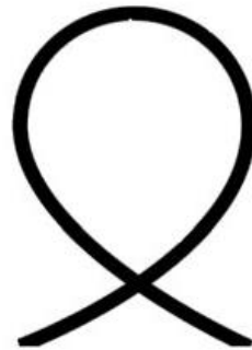
لوپ با زاویه ورود و خروج حداقل 90 درجه